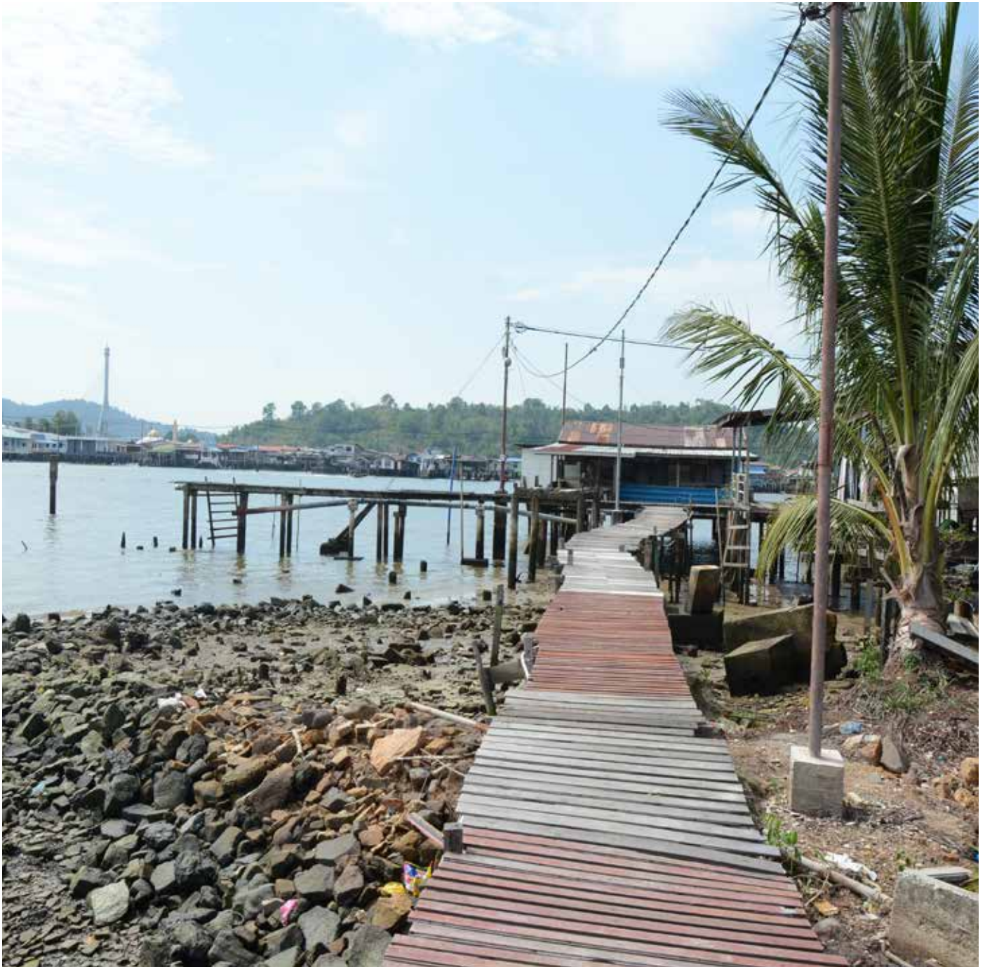
TAPAK ini merupakan kesan peninggalan bekas Masjid Lama yang dibina dekat dengan Bakut Syeikh Haji Ibrahim, manakala gambar di belakang adalah sambungan jambatan yang dulunya menghala ke jambatan tinggi menuju ke pusat bandar.