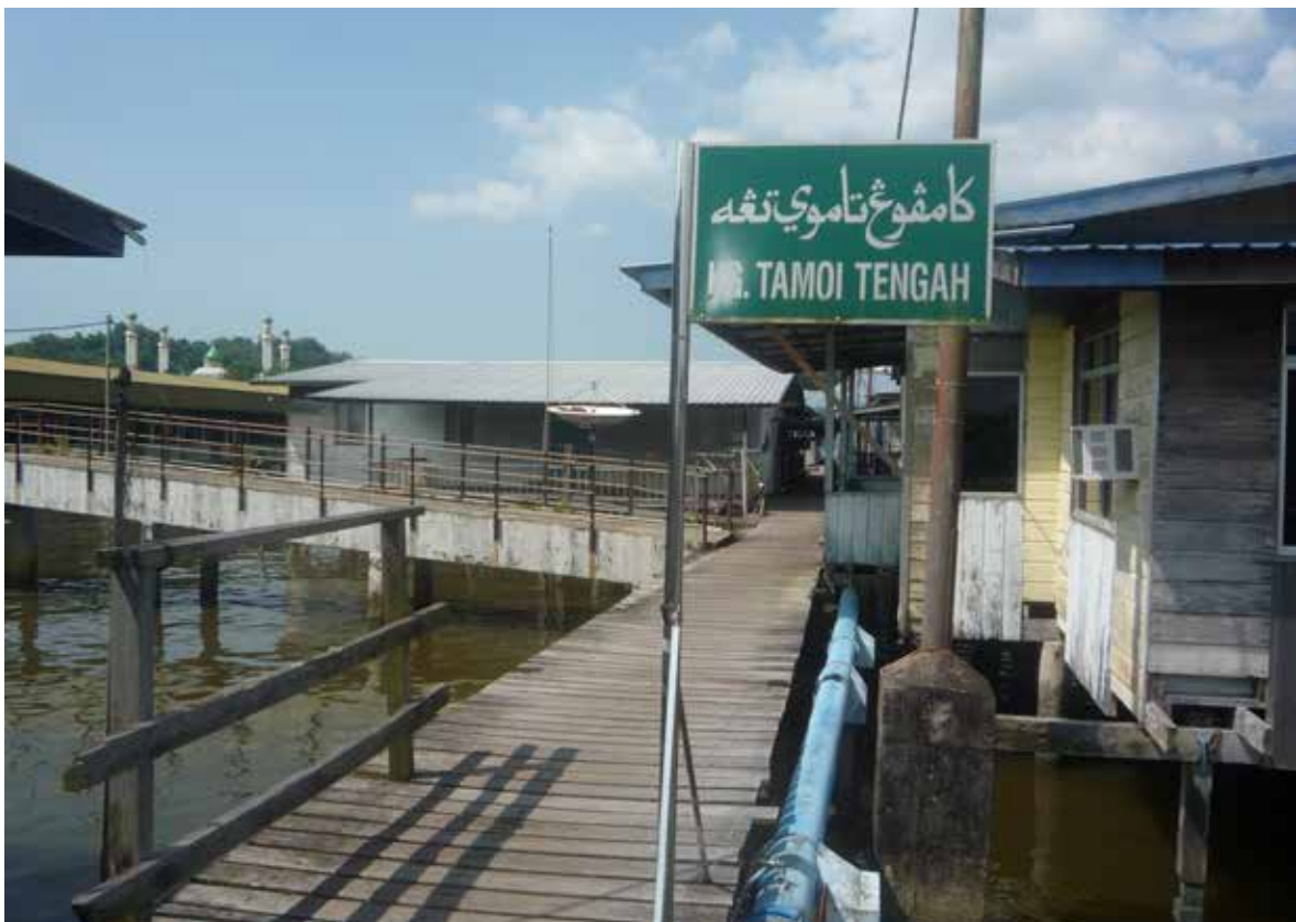
KEDUDUKAN Kampung Tamoi Tengah yang berjiran dengan Kampung Tamoi Ujong.

Pada akhir tahun 1970-an, kampung ini mempunyai persatuannya sendiri yang diberi nama 'ABETA' iaitu singkatan nama Angkatan Belia Tamoi. Persatuan ini aktif terutama dalam bidang kesukanan dan sosial.