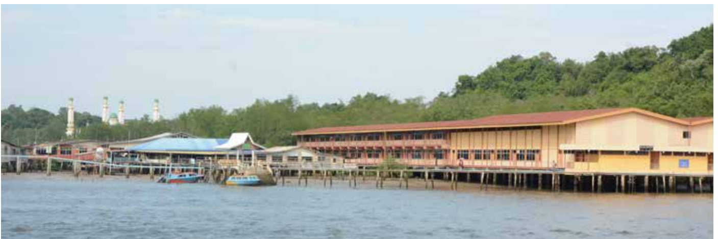
SEKOLAH Rendah Bendahara Lama ini merupakan salah satu kemudahan yang disediakan oleh pihak kerajaan di kampung tersebut.