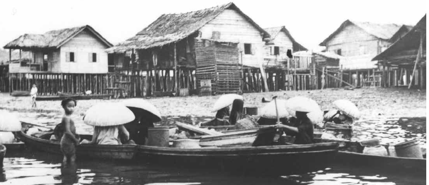
PADIAN yang merupakan legenda di Kampong Ayer merupakan pedagang wanita yang menjual berbagai barangan terutama berupa makanan se harian.