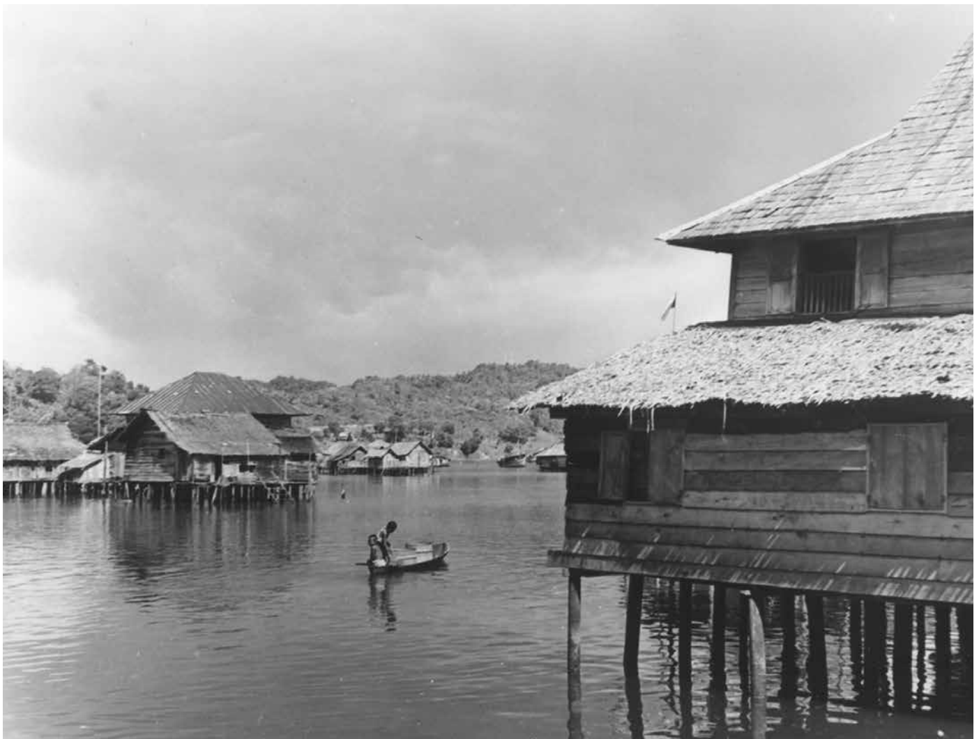
KEADAAN tenang di Kampong Ayer pada suatu ketika dulu.

Negara Brunei Darussalam mempunyai keluasan 5,765 kilometer batu persegi dan terbahagi kepada empat buah daerah iaitu Daerah Brunei dan Muara, Daerah Belait, Daerah Tutong dan Daerah Temburong. Setiap daerah mempunyai beberapa buah mukim di dalamnya yang mana dalam setiap mukim itu terdapat beberapa