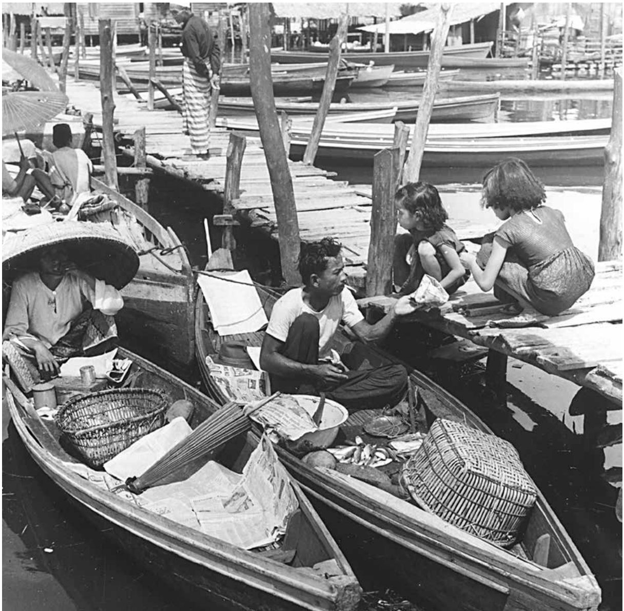
KELIHATAN dua orang kanak-kanak sedang membeli barangan yang dijual oleh pedagang.

Dalam Sejarah Kampung-kampung di Mukim-Mukim pada keluaran kali ini akan mengenalkan kampung-kampung yang ada di bawah Mukim Tamoi. Ini kemudian diikuti dengan kampung-kampung lain di ke empat-empat daerah.