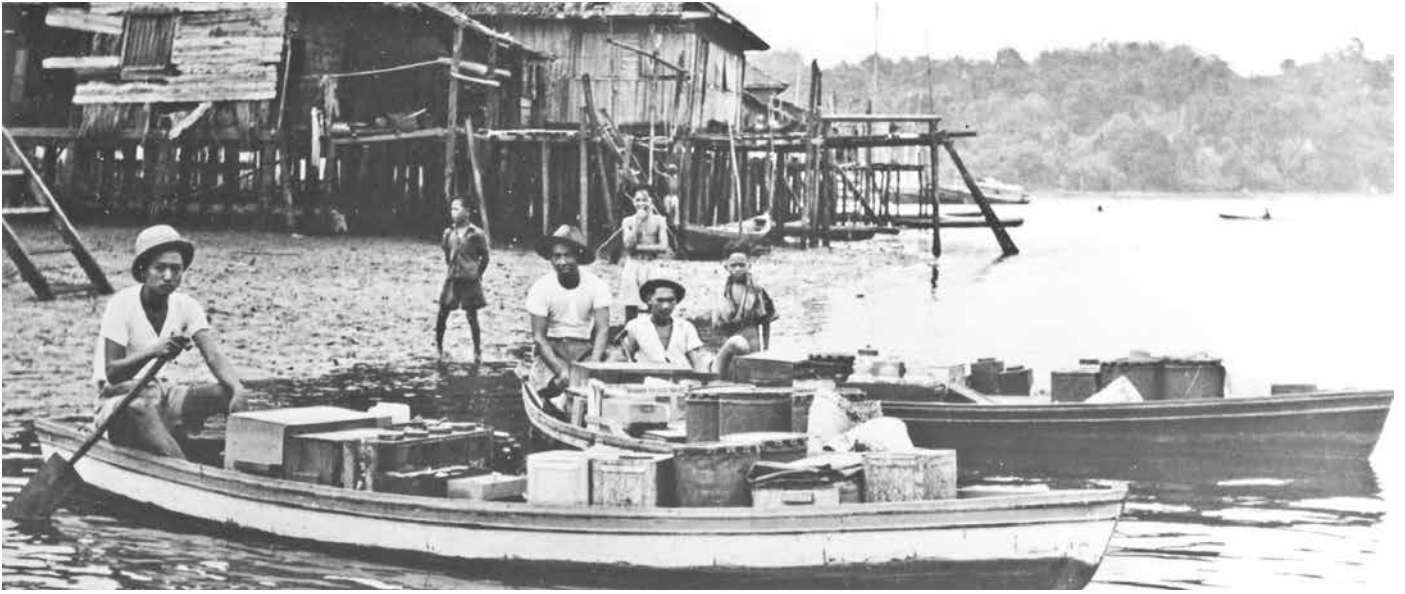
PARA pedagang ketika membawa dagangan mereka untuk urusan jual beli.