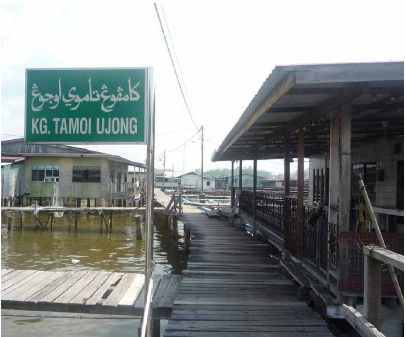
PEMANDANGAN suasana Kampung Tamoi Ujong yang diambil dari sebelah Kampung Tamoi Tengah.

Beberapa tahun kebelakangan, kampung ini sempat menjadi sorotan para pelancong dan pembesar luar negara untuk berkunjung di sini untuk melihat secara dekat tradisi serta kehidupan di Kampung Ayer.