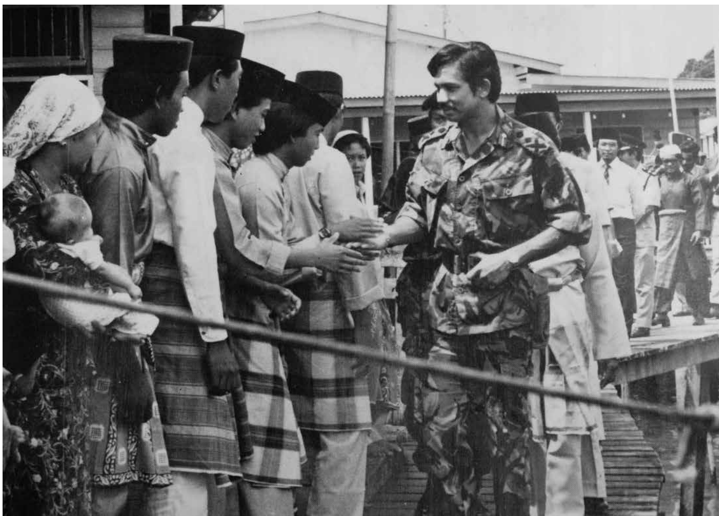
LAWATAN Kebawah Duli Yang Maha Mulia pada tahun 1981 di Mukim Tamoi.