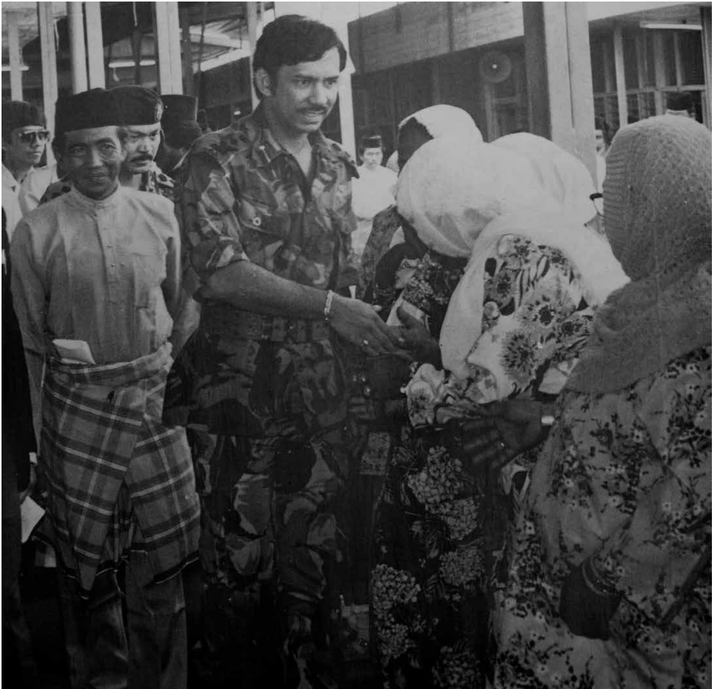
KEBAWAH Duli Yang Maha Mulia berkenan menerima junjung ziarah daripada penduduk-penduduk ketika melawat Mukim Tamoi pada tahun 1981.