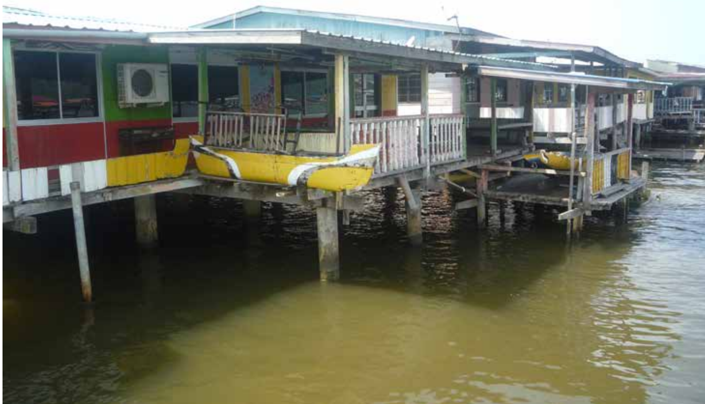
DERETAN rumah-rumah penduduk di Kampung Tamoi Ujong yang pada masa ini.