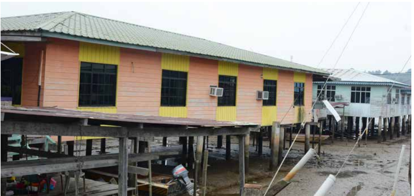
SEBAHAGIAN rumah penduduk di Kampung Pengiran Tajuddin Hitam.

Memasuki tahun 60-an dan awal tahun 70-an keadaan rumah-rumah di kampung tersebut dan sebahagian di Kampong Ayer mula berubah di mana rumah-rumah mula dibina dengan bertiangkan konkrit dan beratapkan zink serta berdingkan papan.