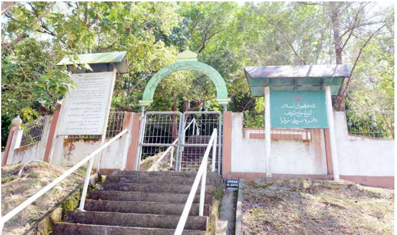
BEKAS tapak telaga air yang dipanggil Kandang Batu yang terletak di antara persimpangan menuju Makam Diraja dan letak kereta di Mukim Tamoi.