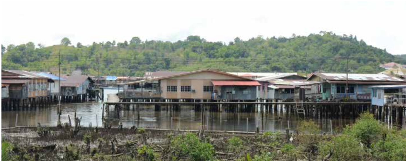
PEMANDANGAN Kampung Pengiran Pekerma Indera Lama (kanan) yang berjiran dengan Kampung Pengiran Bendahara Lama (kiri).