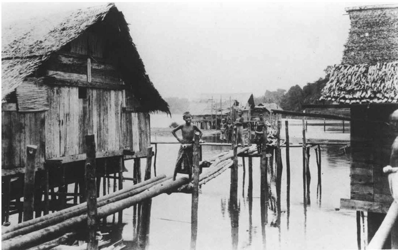
DERETAN rumah-rumah lama yang terdapat di Kampong Ayer yang kini menjadi ristaan sejarah.