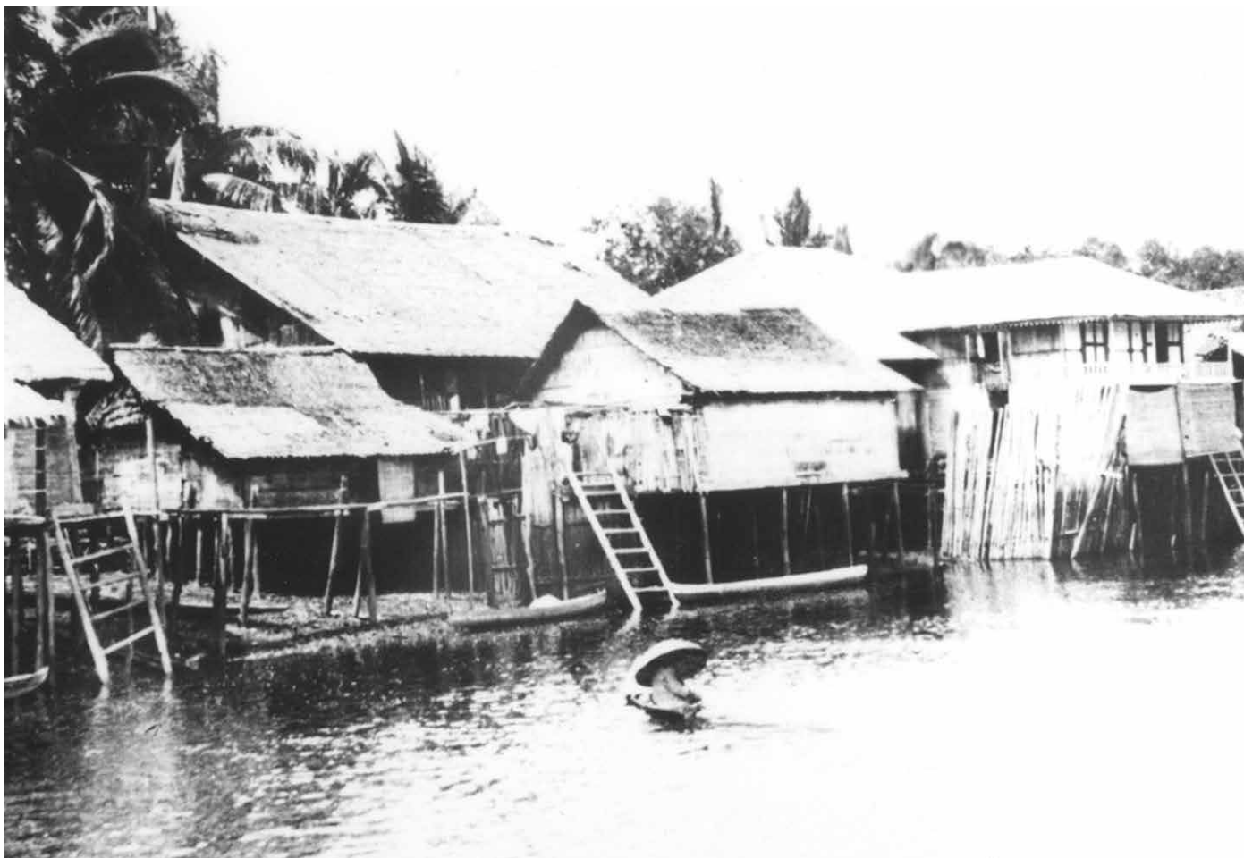
PEMANDANGAN yang indah di sebuah kampung pada waktu dulu dengan padian menjual barang dagangannya.