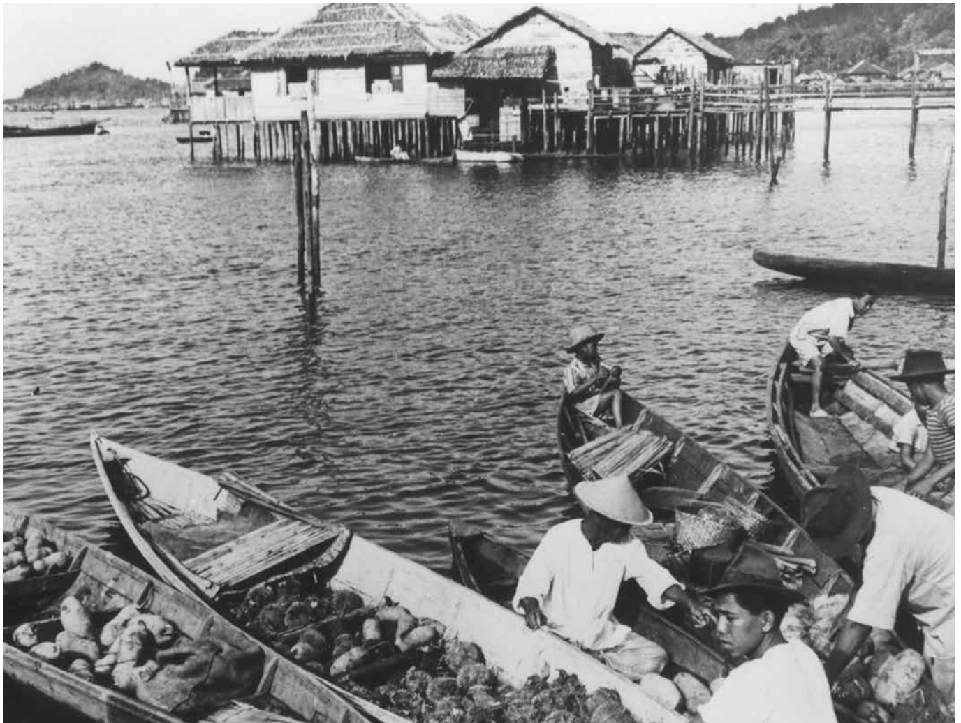
KEADAAN para pedagang menjual barangan mereka dengan menggunakan sampan.

Kewujudan Kampung Ayer sememangnya tidak dapat ditebak dengan pasti namun para pengkaji sejarah telah mencatatkan keberadaannya lebih awal dari Abad Ke-16.