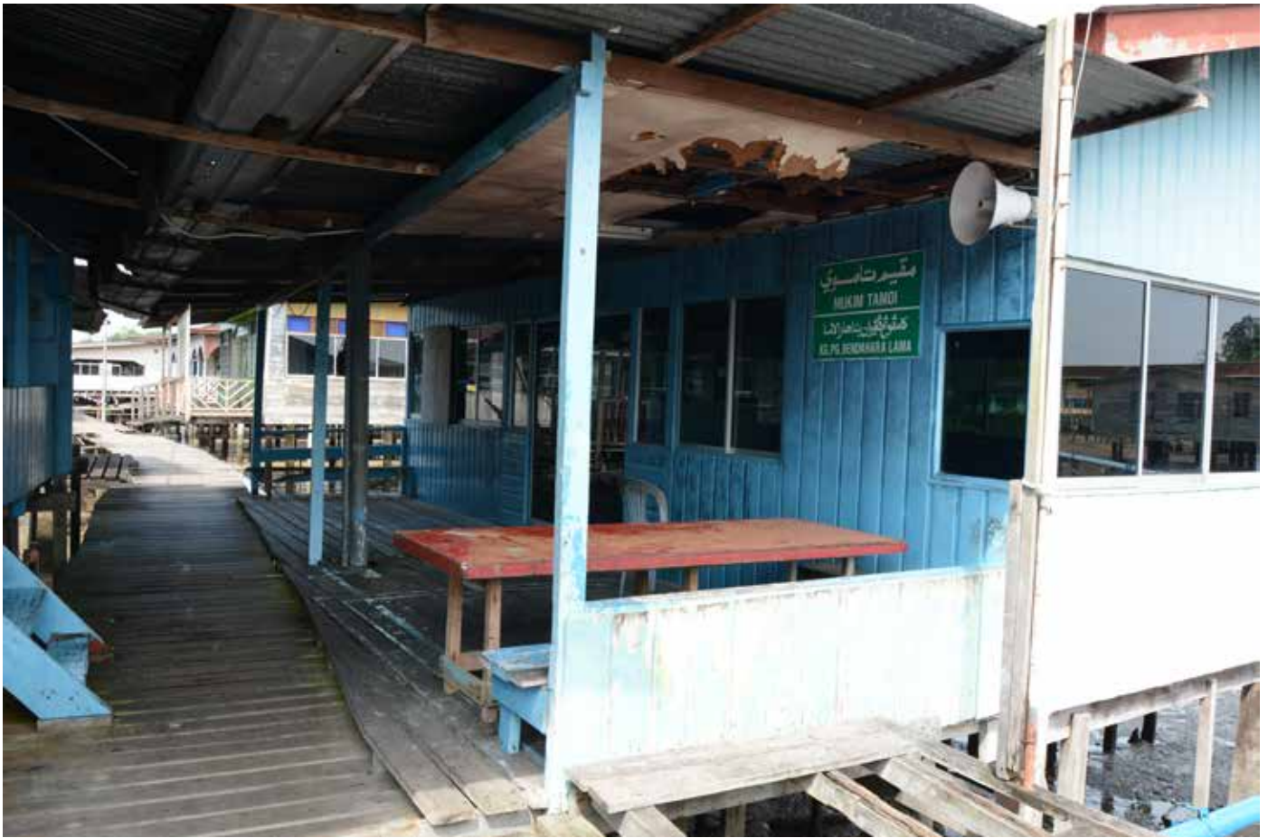
BALAI RAYA ini digunakan bagi mengadakan berbagai kegiatan penduduk kampung.