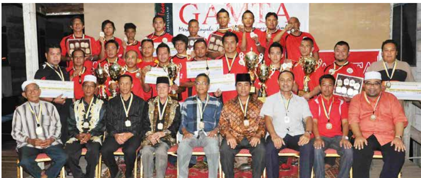
PASUKAN Lumba Perahu Mukim Tamoi bergambar ramai setelah memenangi beberapa acara dalam sukan lumba perahu.