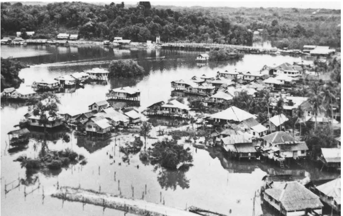
GAMBAR lama ini menunjukkan beberapa buah perkampungan yang terletak di ibu negara pada suatu masa dulu antaranya Kampung Bukit Salat, Kampung Sumbiling Lama dan Kampung Sumbiling Baharu.

Pada tahun 1977, pentadbiran Kampong Ayer telah mengalami perubahan struktur pentadbirannya dengan membahagikan Kampung-kampung Ayer tersebut kepada enam mukim. Setiap mukim mengandungi beberapa buah kampung di bawahnya dengan diawasi oleh seorang penghulu dan setiap kampung pula masing-masing dijaga oleh seorang ketua kampung.