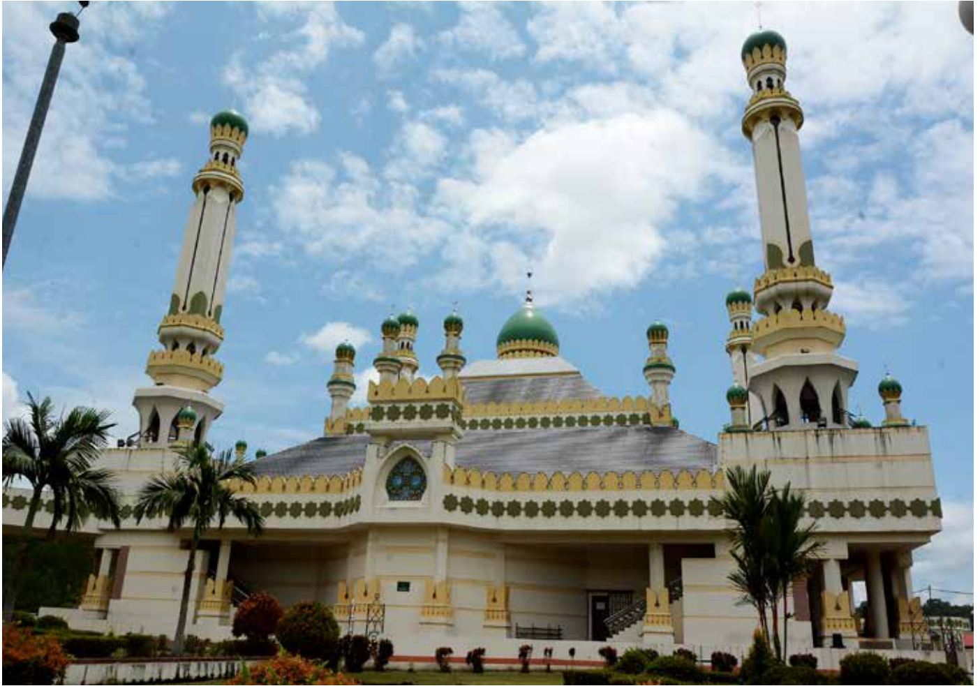
MASJID Duli Pengiran Muda Mahkota Pengiran Muda Haji Al-Muhtadee Billah merupakan salah satu mercu tanda di Mukim Tamoi.